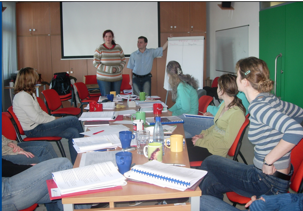
Obr. –Rekvalifikační kurz Lektor – specialista na přípravu osob na zaměstnání, 7. prosince 2006