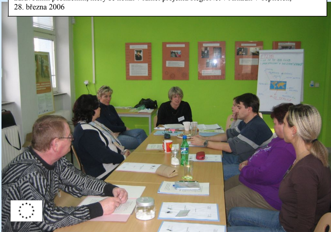
Obr. – Job klub – motivačně-poradenský program přípravy na zaměstnání pro osoby se zdravotním postižením, který se konal v rámci projektu RegioNet v Arkadii v Tepličích, 28. března 2006